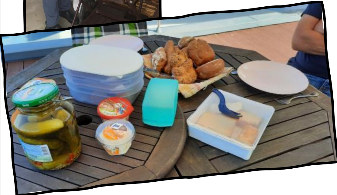
Von der Idee zum fertigen Messer